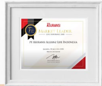
Allianz Life Indonesia Raih Penghargaan Insurance Market Leader Awards 2020

Allianz Utama Indonesia dinilai sebagai perusahaan asuransi yang memiliki manuver dan inovatif menarik di tahun 2020, terbukti dengan penyediaan layanan digital Az-Net yang mudah dan cepat; Allianz eAZy Learn, program baru untuk mendukung pemahaman mengenai digital innovation bagi mitra bisnis; serta kolaborasi strategis dengan JD.ID